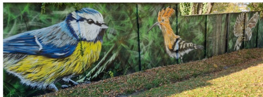
Trois des 5 animaux représentés sur la clôture d'enceinte de l'hôpital Charles Perrens.

Le chat n'est la seule trace du passage de l'artiste dans ce centre. Poursuivez votre promenade en remontant la côte et cherchez la clôture en béton gris qui sert d'enceinte. Elle est colorée de graphes. Ce ne sont pas ceux d'A-MO, continuez et à mi-côte plusieurs animaux vous accueillent : la mésange bleue, la huppe et la chouette qui sont encadrées par le renard et le cerf majestueux.