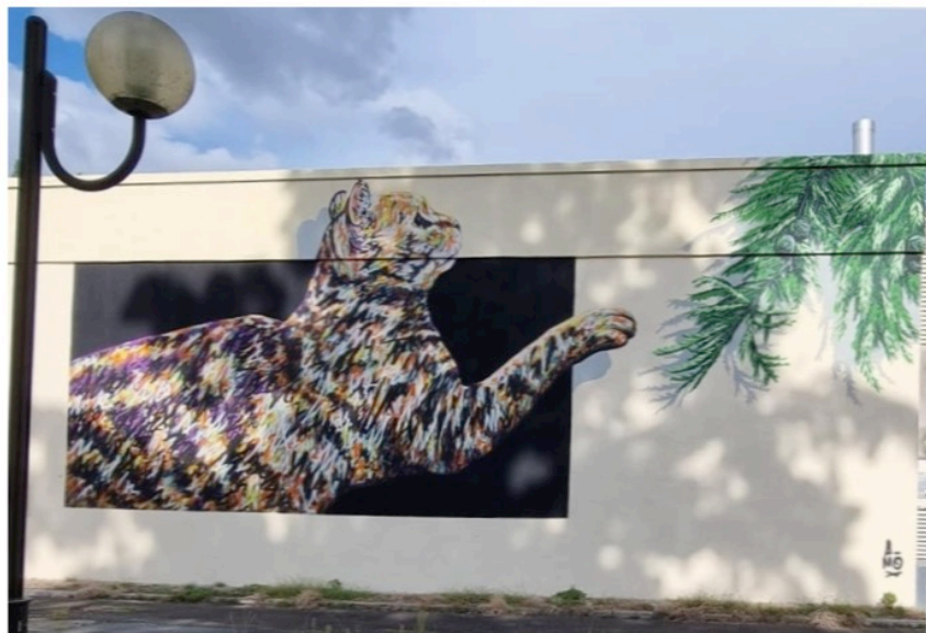
Le chat-A-MO lève la patte avec bienveillance vers le cyprès chauve.

Il a été inauguré au mois de septembre dernier en présence de l'auteur.