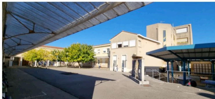
Le collège a été restructuré en 1987

Entre 1862 et 1868, on y trouve une école privée entretenue par la fabrique de Saint-Augustin et dirigée par les frères de la doctrine chrétienne. Une donation à la ville de Bordeaux permettra de créer en 1869 une école de garçons gratuite. Le collège lui sera créé en 1969 puis restructuré en 1987.